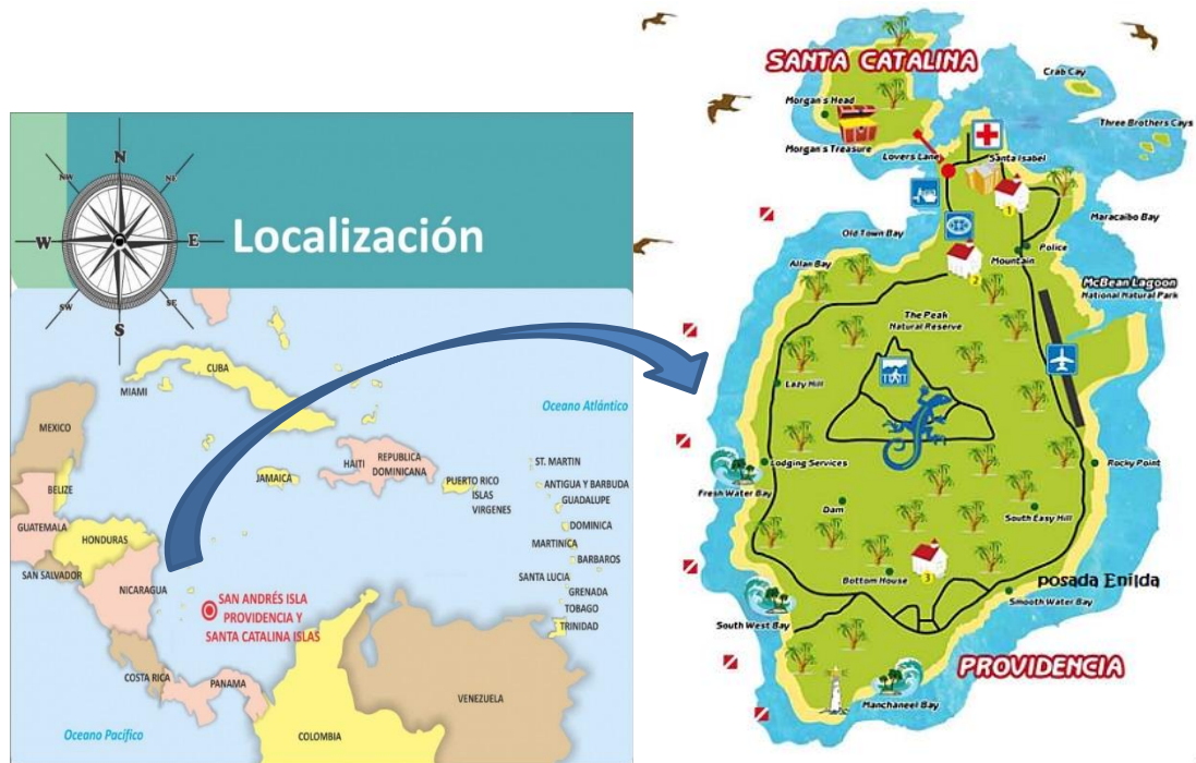
Figura 1 Localización Geográfica

El proyecto se encuentra localizado en el sendero existente que conduce al cerro denominado “El Pico”, que se encuentra ubicado en el centro de la isla, cuyo inicio se encuentra localizado aproximadamente a 500 mts de la vía principal perimetral que bordea la isla.