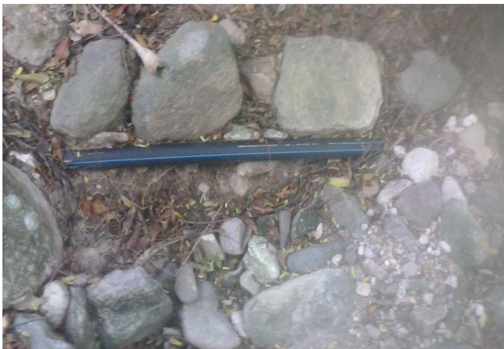
Aspecto tubería a reubicar