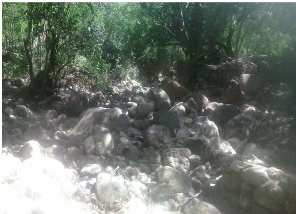
Aspecto acumulacion de rocas en zona de arroyo