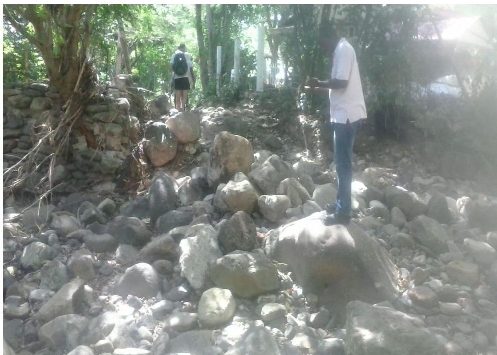
Aspecto acumulacion de rocas en zona de arroyo